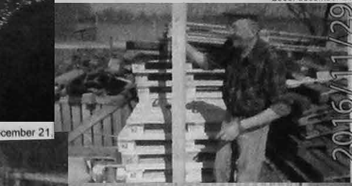
2006. december 21