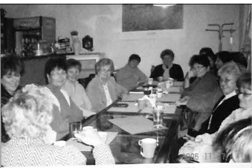
"Összefogás Kisapostagi Nőegylet" alakuló ülés