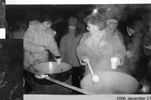
2006. december 21