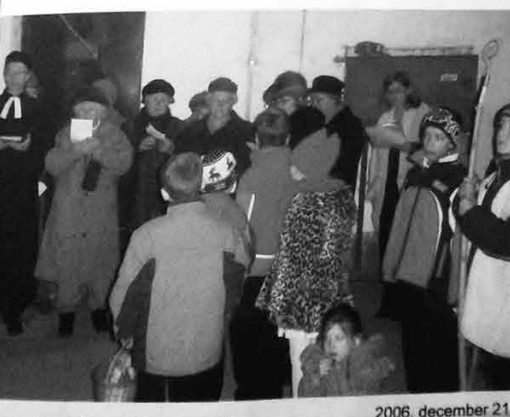
2006. december 21