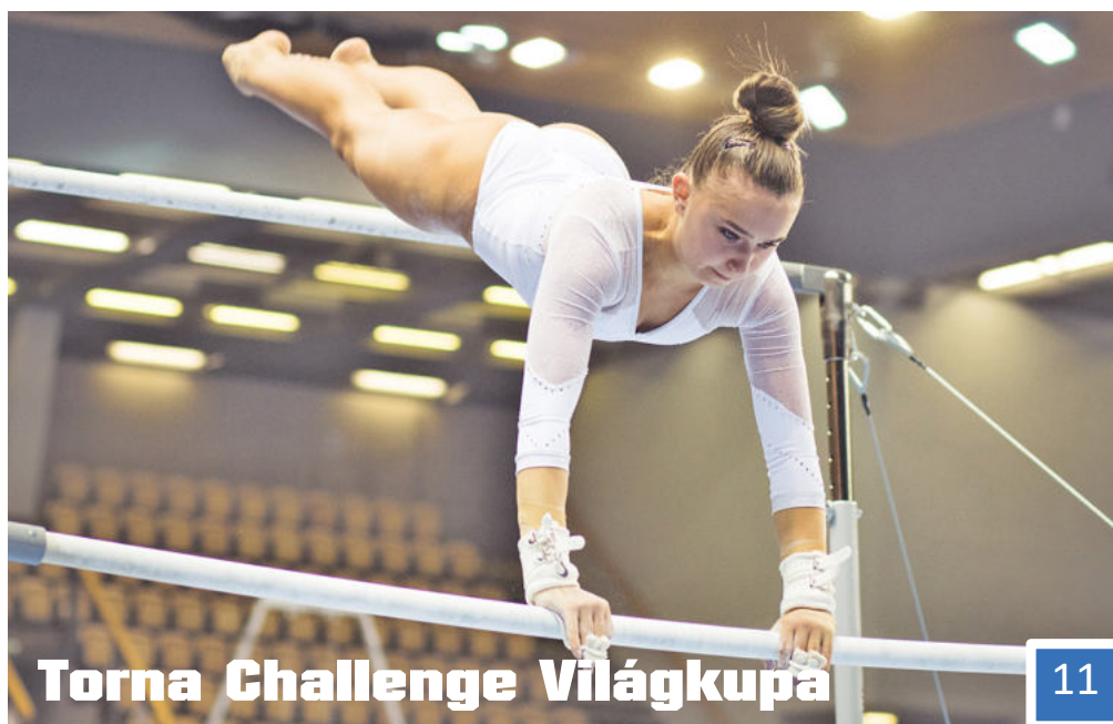
Torna Challenge Világkupa