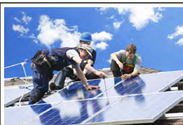
Napelemet nyerhet az óvoda Folytatás a 6. oldalon